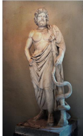
Obrázek 1 Asclépios a jeho hůl

Velký význam měl také v této době otec medicíny antický lékař Hippokratés z Kósu a Galénos.