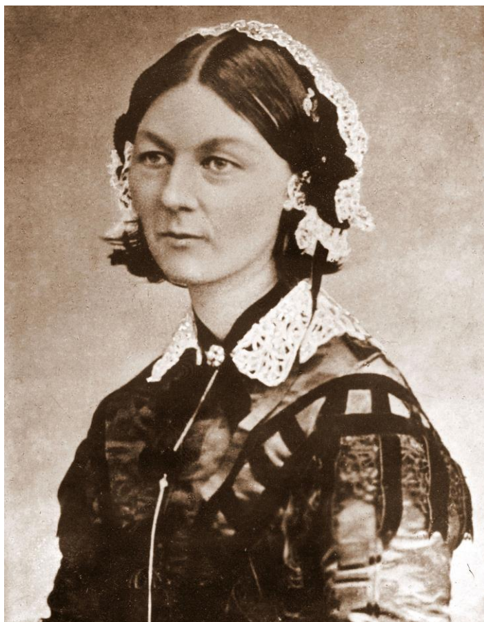
Obrázek 2 Florence Nightingalová

Významnou osobností světového ošetřovatelství je anglická ošetřovatelka Florence Nightingalová (1820 – 1910).