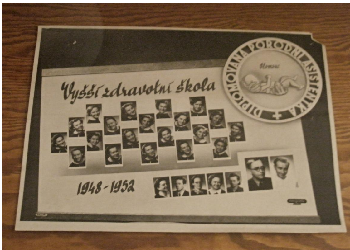
Obrázek 4 maturitní tablo

Po válce se naléhavě zvýšila poptávka po kvalifikovaném ošetrovatelském personálu, a tak se rozrůstala síť ošetrovatelských škol. V roce 1946 byla v Praze otevřena Vyšší ošetrovatelská škola, které připravovala sestry – učitelky pro pedagogickou činnost a vrchní sestry pro vedoucí práci v ošetrovatelství.