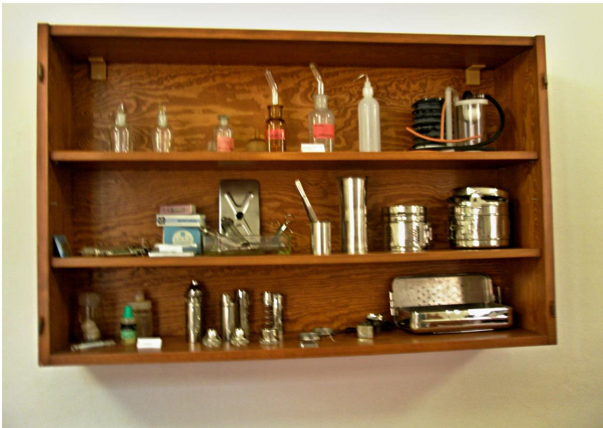
Obrázek 3 archiv ošetrovatelských pomůcek

Medicína je úzce spjata s mnoha humanitními a technickými obory, které procházejí neustálým vědeckým vývojem společně s ošetrovatelstvím.