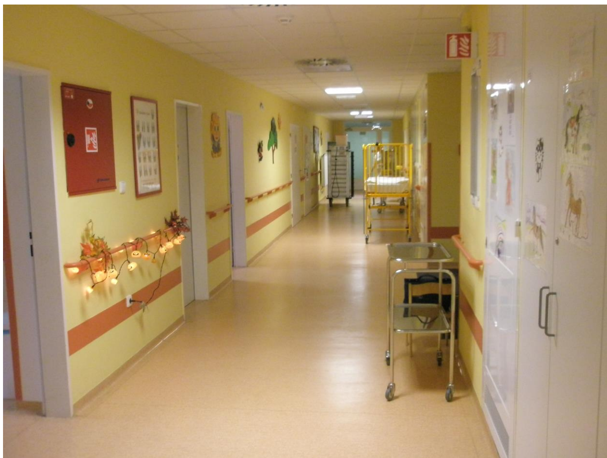
Obrázek 13 Dětská OJ

Ošetrovací jednotky pro děti jsou více barevné, stěny jsou zdobené dětskými motivy, OJ jsou vybaveny dětským nábytkem, hernou a hračkami. Nemocniční pokoje připomínají spíše dětský pokoj v domácím prostředí, jejich vybavení je přizpůsobené věku dětí, je bezpečné a dobře omyvatelné.