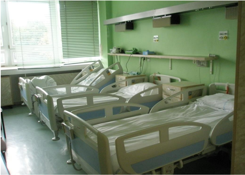
Obrázek 14 Pokoj pro větší děti

Ošetrovací jednotka pro větší děti (3 – 18 let) má pokoje pro 2 – 3 lůžka, pro předškoláky jsou menší postele s postranicemi a lůžko pro matku, toalety jsou přizpůsobené věku dětí, pokoje jsou vybaveny TV, stolem a židlemi. Součástí ošetrovací jednotky je i učebna s učebními pomůckami, s PC a tabulí.