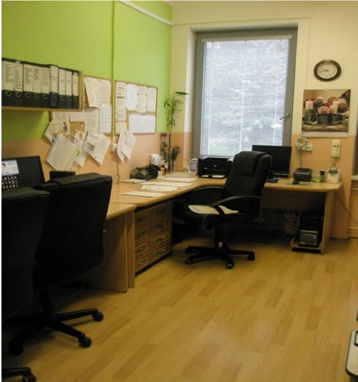
Obrázek 8 Pracovna sester