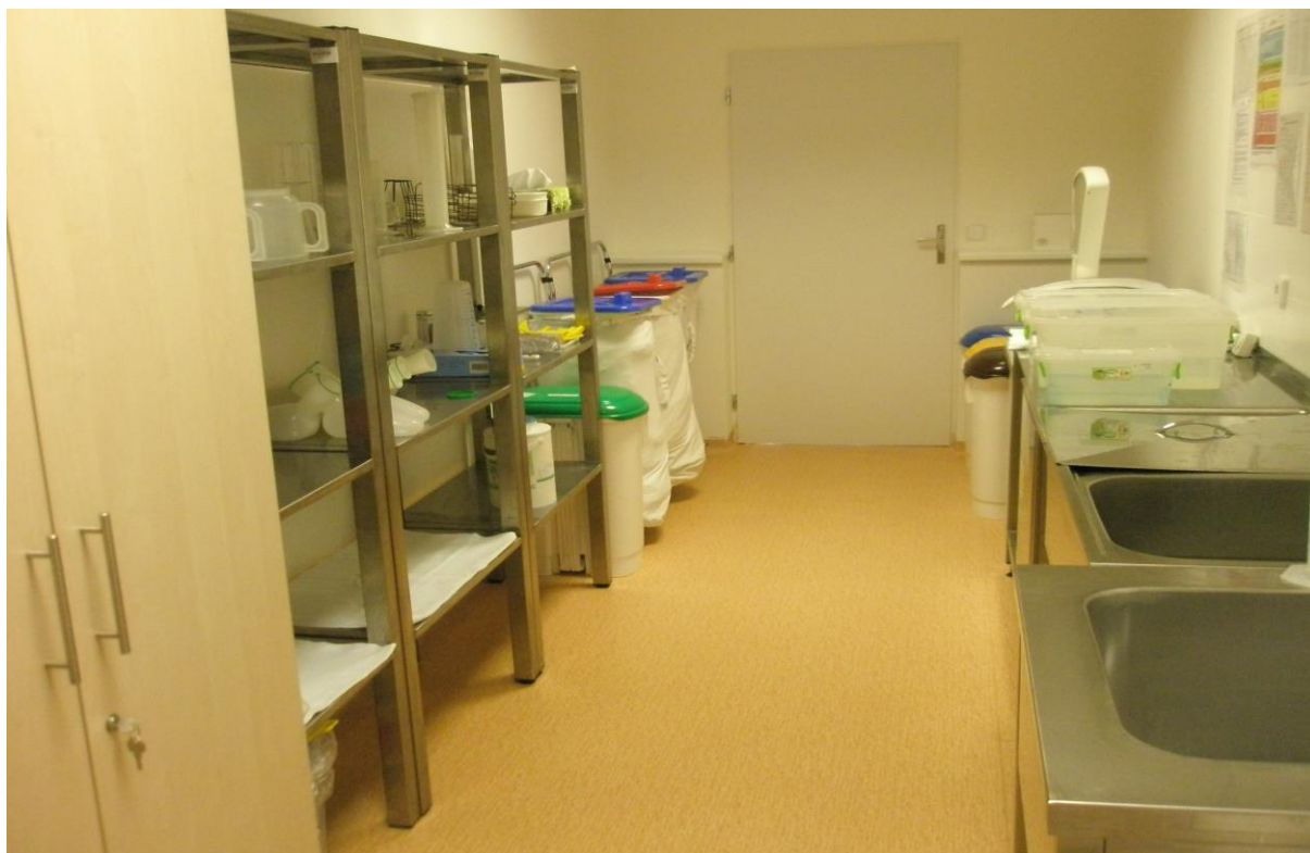
Obrázek 12 Čistící místnost