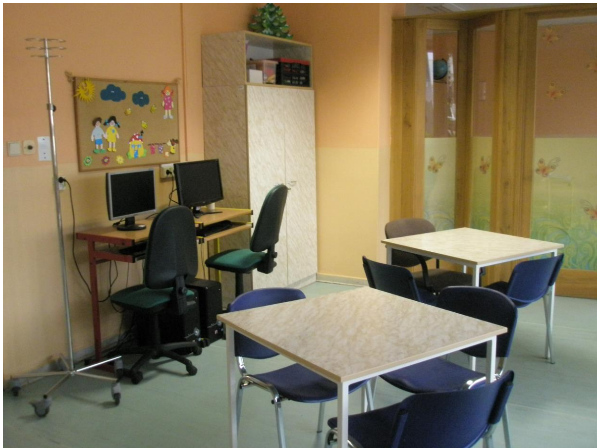
Obrázek 10 Denní místnost