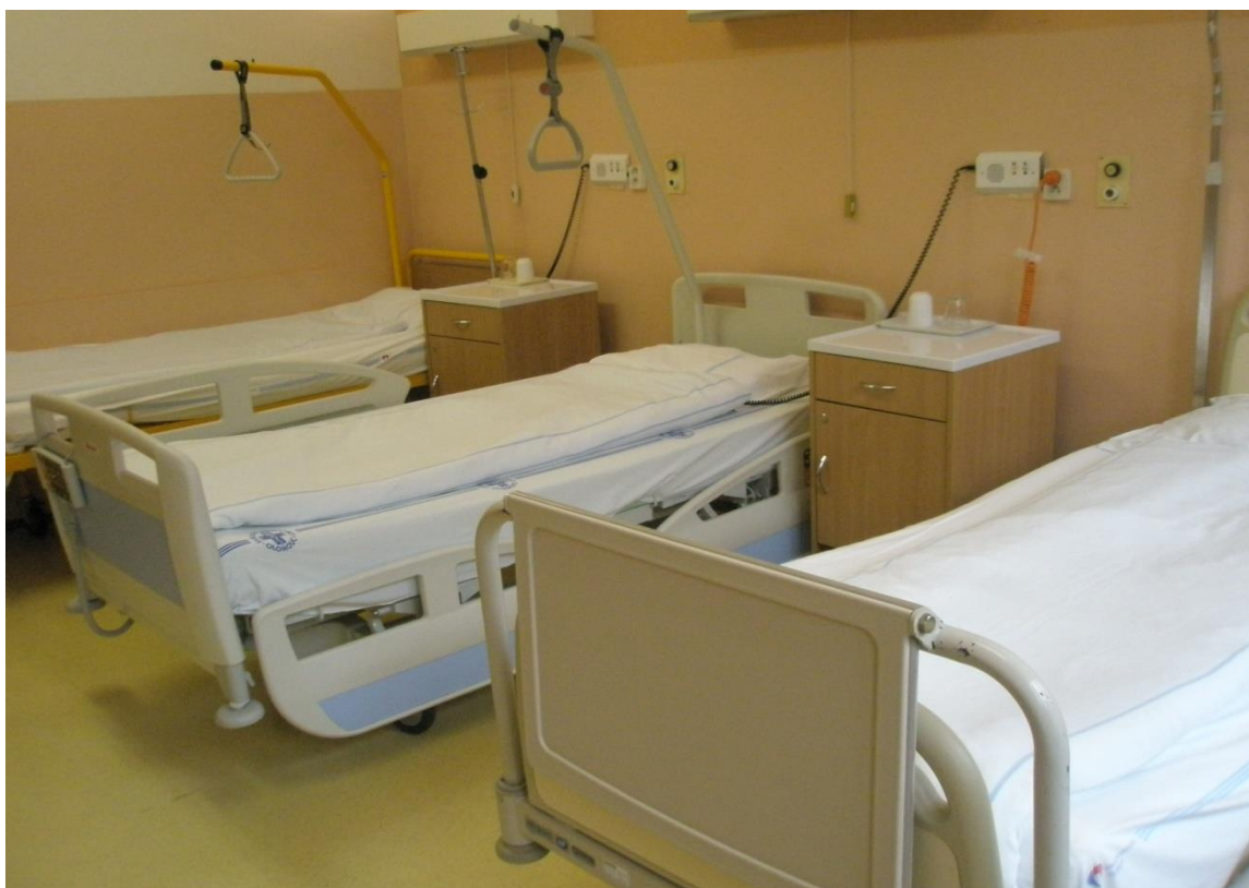
Obrázek 4 Pokoj nemocných

Oddělení nabízejí pacientům také možnost nadstandardních pokojů, vybavení těchto pokojů se liší např. lednicí, TV, připojením na internet. Pacienti zde mají větší soukromí, zařízení pokoje připomíná více domácí prostředí a umožňuje delší přítomnost rodinných příslušníků.