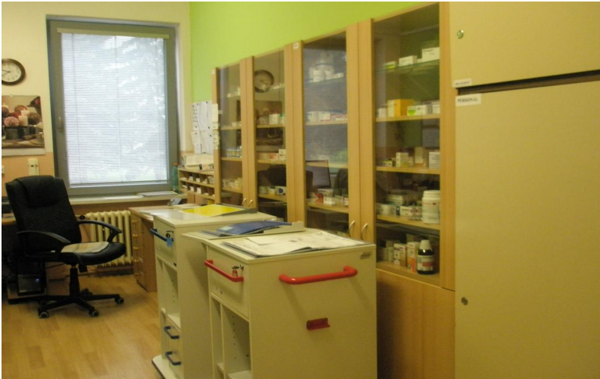
Obrázek 7 Pracovna sester