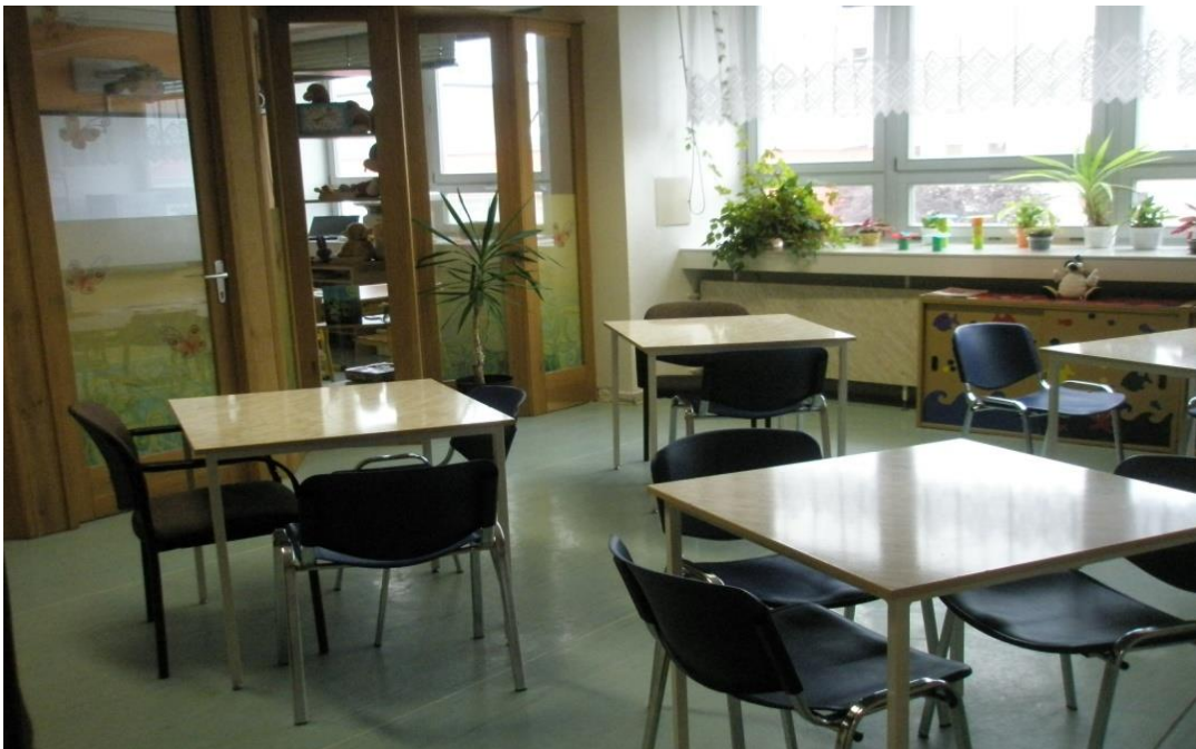
Obrázek 6 Jídelna