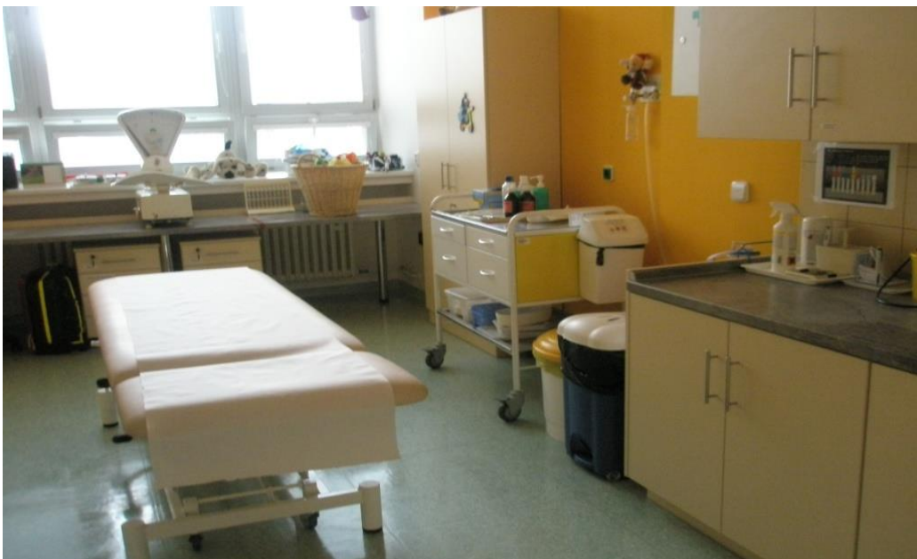
Obrázek 9 Vyšetřovna