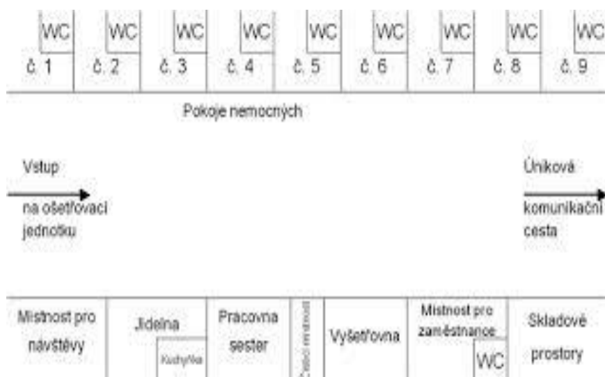
Obrázek 1 Oboustranná OJ