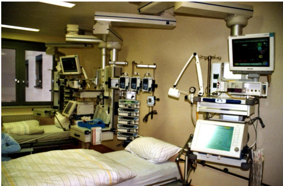
Obrázek 3 Jednotka intenzivní péče