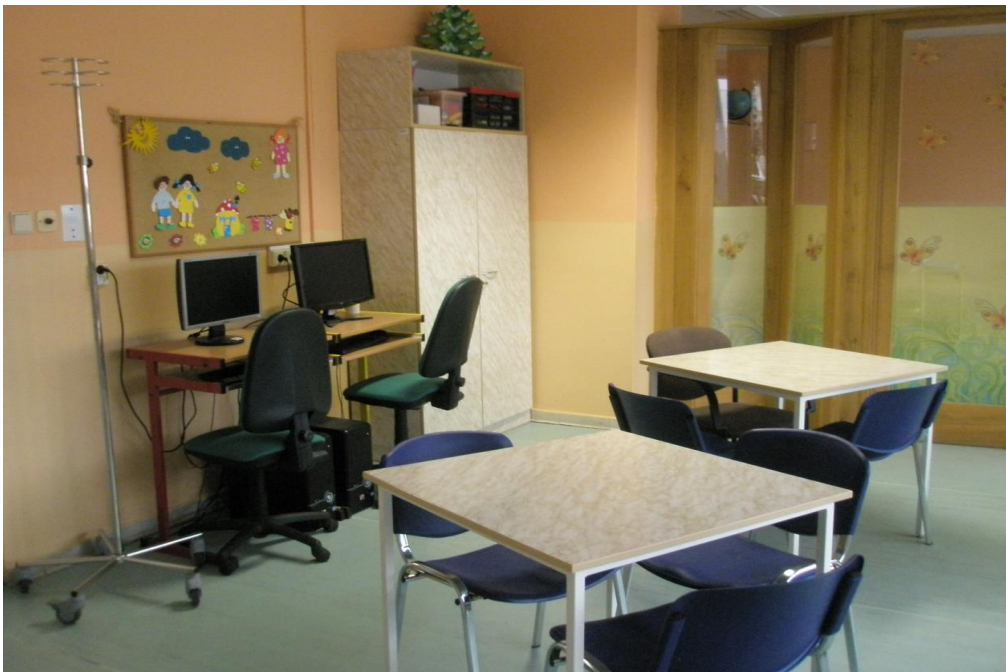
Obrázek 15 Denní místnost pro větší děti