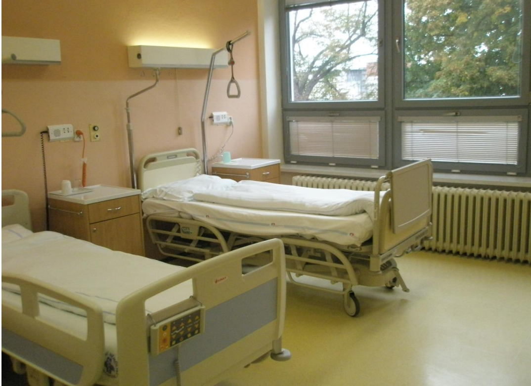
Obrázek 5 Pokoj nemocných