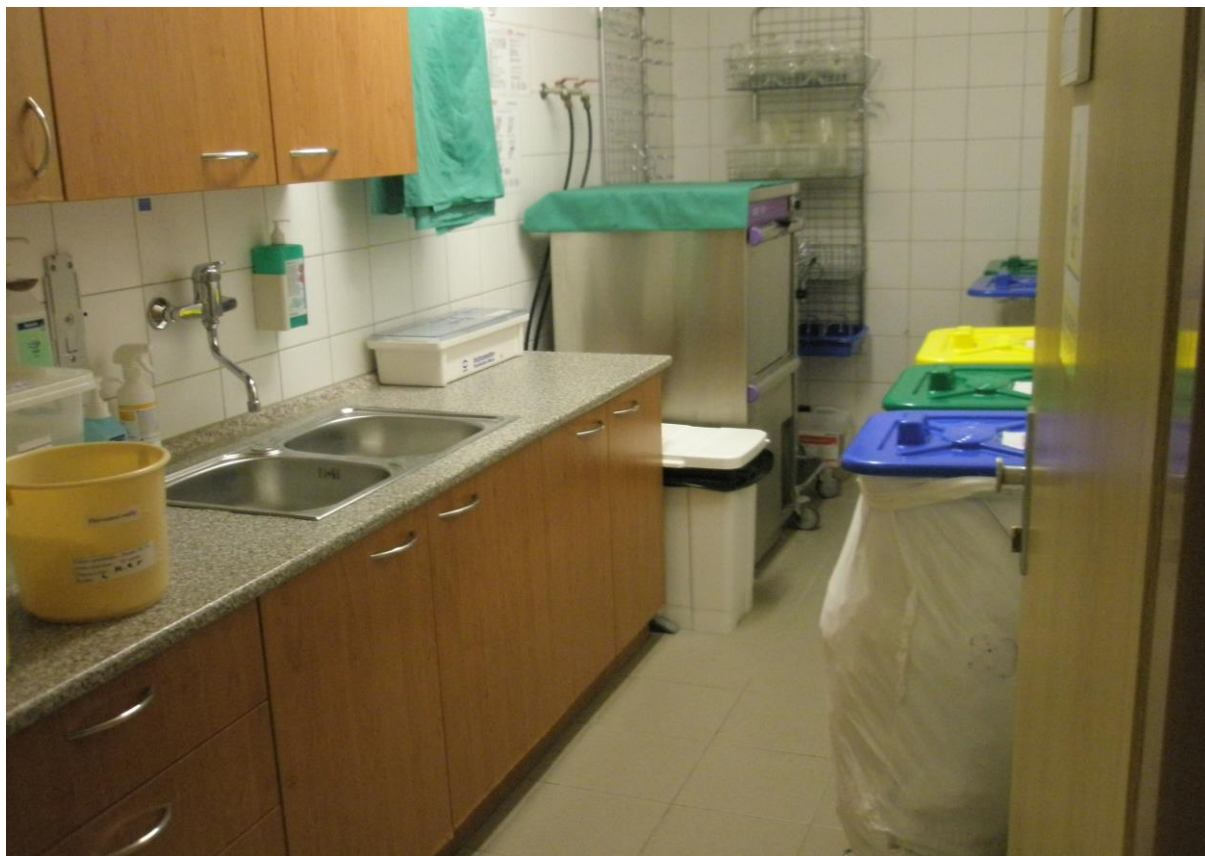
Obrázek 11 Čistící místnost